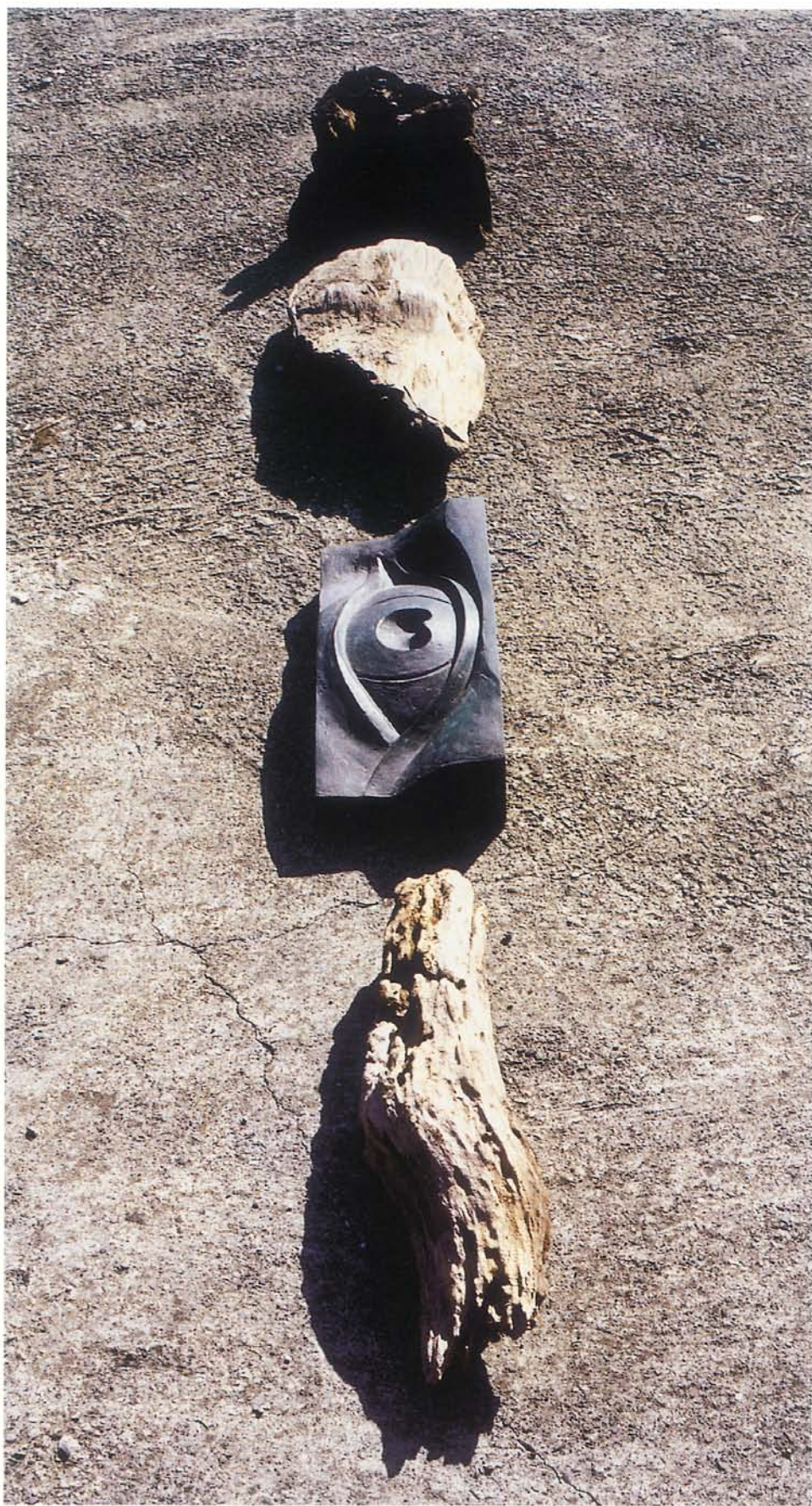
見 青銅・木 300×50×40cm 2001