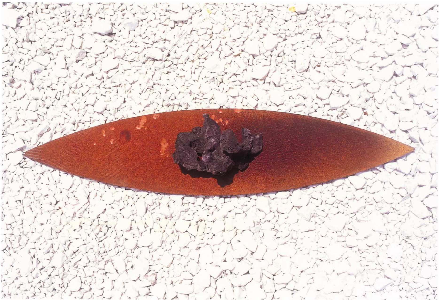
觀 木·石·鋼鐵 130×70×20cm 2001