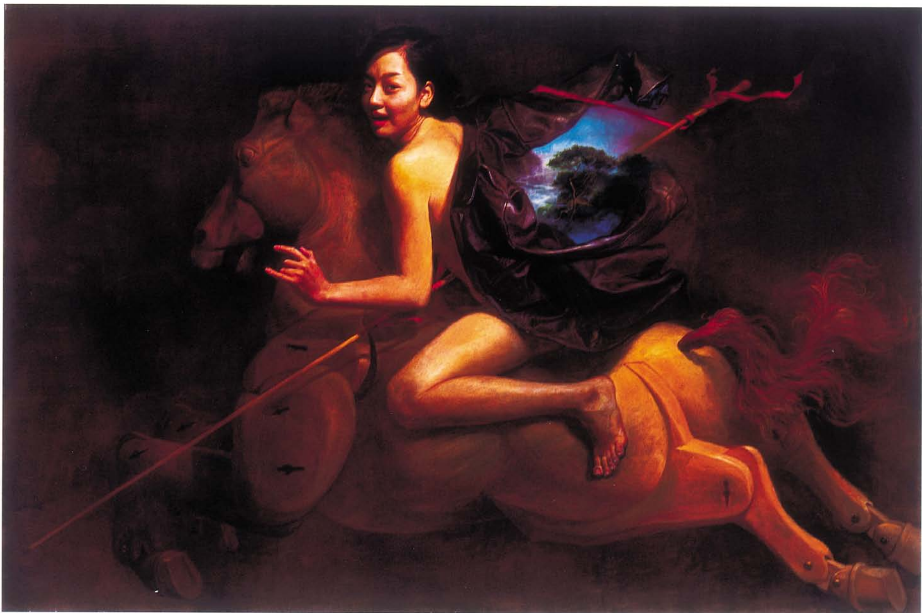
理想 油彩 120F 2001