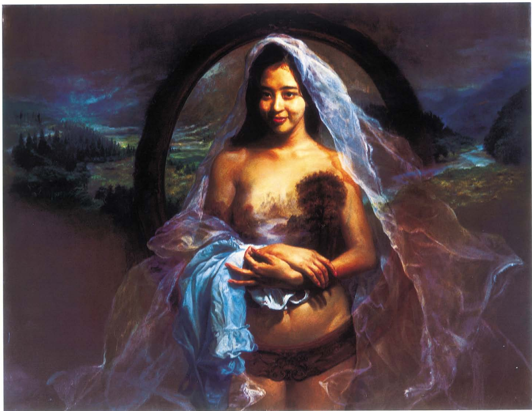
新娘 油彩 80F 2001